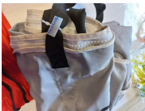
Tas voor reddingsvesten