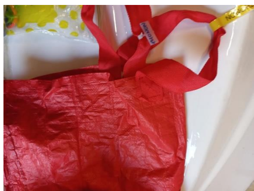
Tas voor bankjes